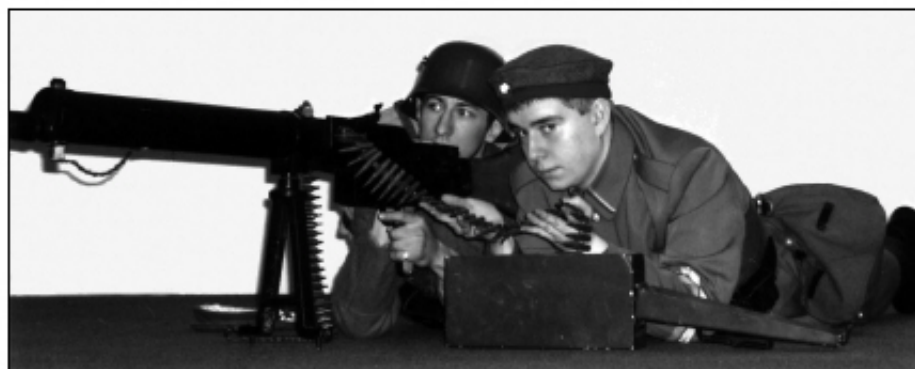
Fot. 7. Grupa Rekonstrukcji Historycznej „Grolman”

Powstanie bardzo szybko ogarnęło całą Wielkopolskę – powstańcom zajęło to zaledwie kilkanaście dni. Pierwszą fazę powstania czasami określa się terminem „działań spontanicznych”. Nie kierowało nimi odgórne dowództwo – wręcz przeciwnie, były to działania oddolne. Rozwijały się niesłyszalnie żywiolowo, co świadczyło o ogromnej chęci oderwania Wielkopolski od Niemiec i przyłączenia jej do Polski. Ze strony ośrodka centralnego zabrakło jakiegokolwiek koordynacji działań lokalnych. Zdarzało się nawet, że działania te prowadzono wbrew woli władz i jakiegokolwiek wsparcia z ich strony. Często Rady Ludowe ograniczały swą działalność do wprowadzania zmian w szkolnictwie, czy też do powołania służb porządkowych. Postępowały one zgodnie z polityką Komisariatu NRL, który sprzeciwiał się działaniom zbrojnym, gdyż liczył, że sprawę polską rozstrzygnie politycznie konferencja pokojowa, z korzyścią dla Polaków.