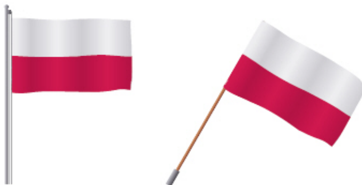
Najwłaściwsze sposoby eksponowania flagi