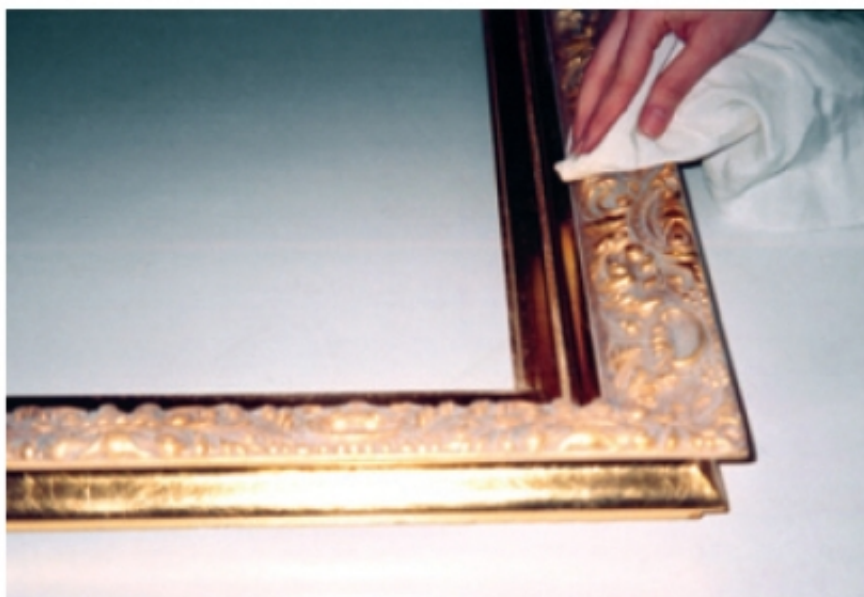
Fot. 13. Usuwanie pigmentu z wypukłych partii ornamentu