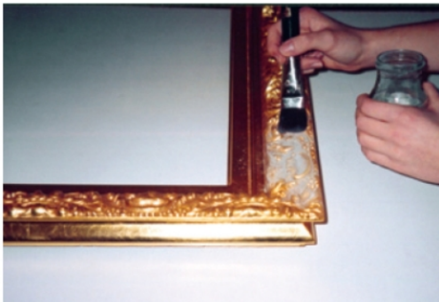
Fot. 12. Nakładanie suchej patyny (pigmentu)