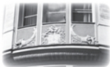
W środkowej płyciźnie kosz z owocami, po bokach rogi obfitości