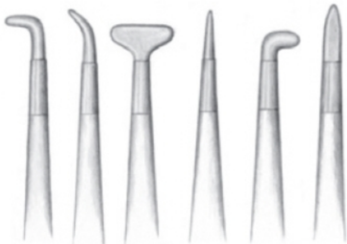
Rys. 4. Agaty

Po dłuższym czasie używania agaty jak wszystkie narzędzia ulegają zniszczeniu. Najczęściej na powierzchni kamienia powstają mikroskopijne rysy, które przy polerowaniu powodują zarysowania na pozłocie. Wówczas uszkodzony agat należy wygładzić. Można to zrobić bez większych trudności we własnym zakresie. Na twardym podłożu, np. klocku z twardego drewna, położyć kawałek nielicowanej skóry, posypać sproszkowanym pumeksem* i szlifować agat, aż do usunięcia zadrapania. Na koniec można go wygładzić w ten sam sposób, zastępując pumeks kredą (bardzo czystą – bez piasku). Niektórzy pozłotnicy do wygładzania kamieni stosują pastę polerską.